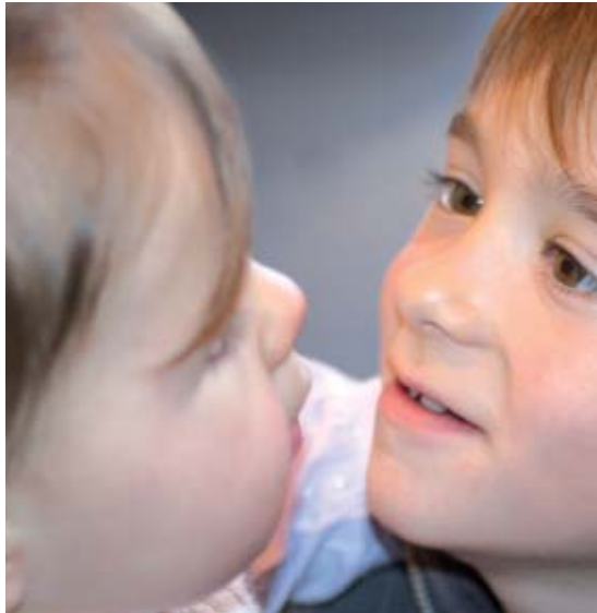
Crèches et garderies