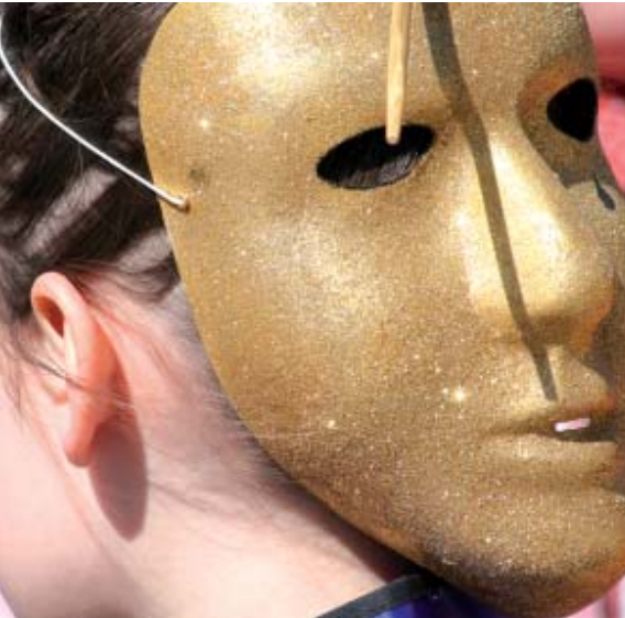
Centre de loisirs